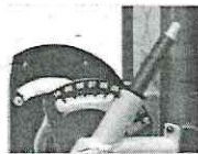
Sistema Rapid Flip