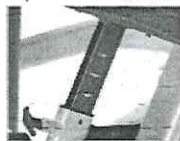
Pontos de regulagem com indicação numérica