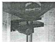
Placa intermediária de 2,5kg