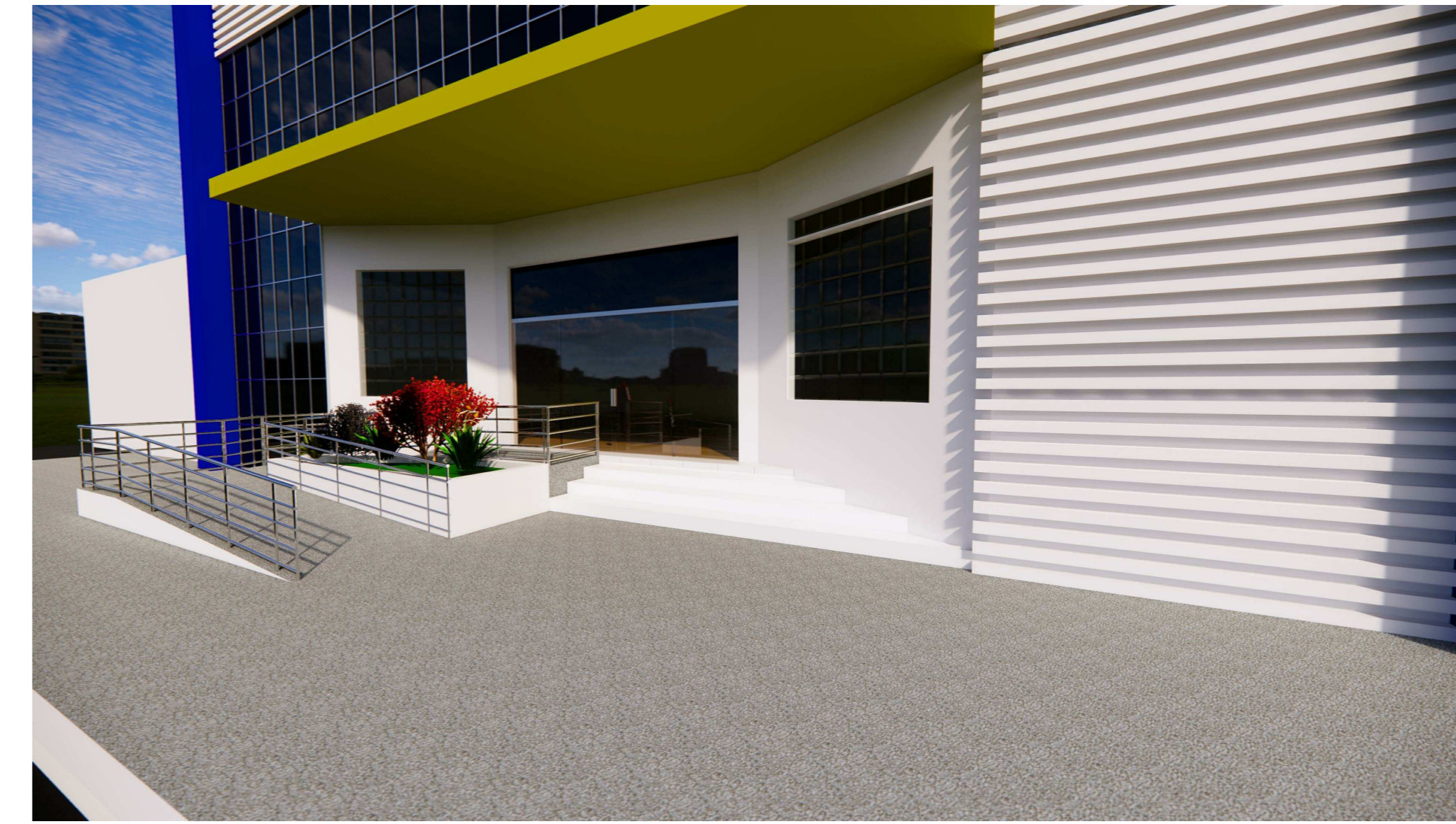
PERSPECTIVA FRONTAL 05 ESCALA: 1:5