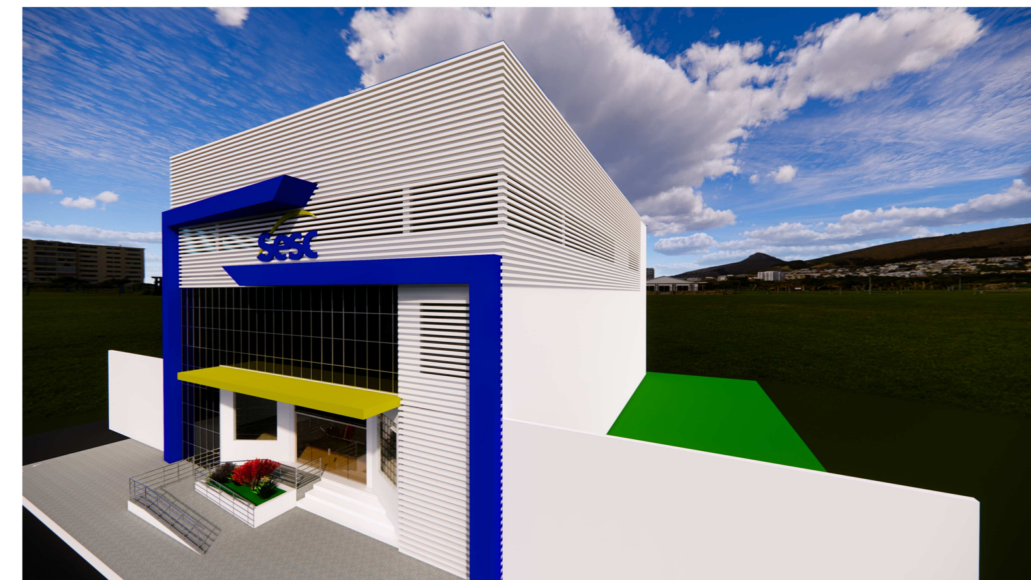
PERSPECTIVA LATERAL DIREITA ESCALA: 1:5