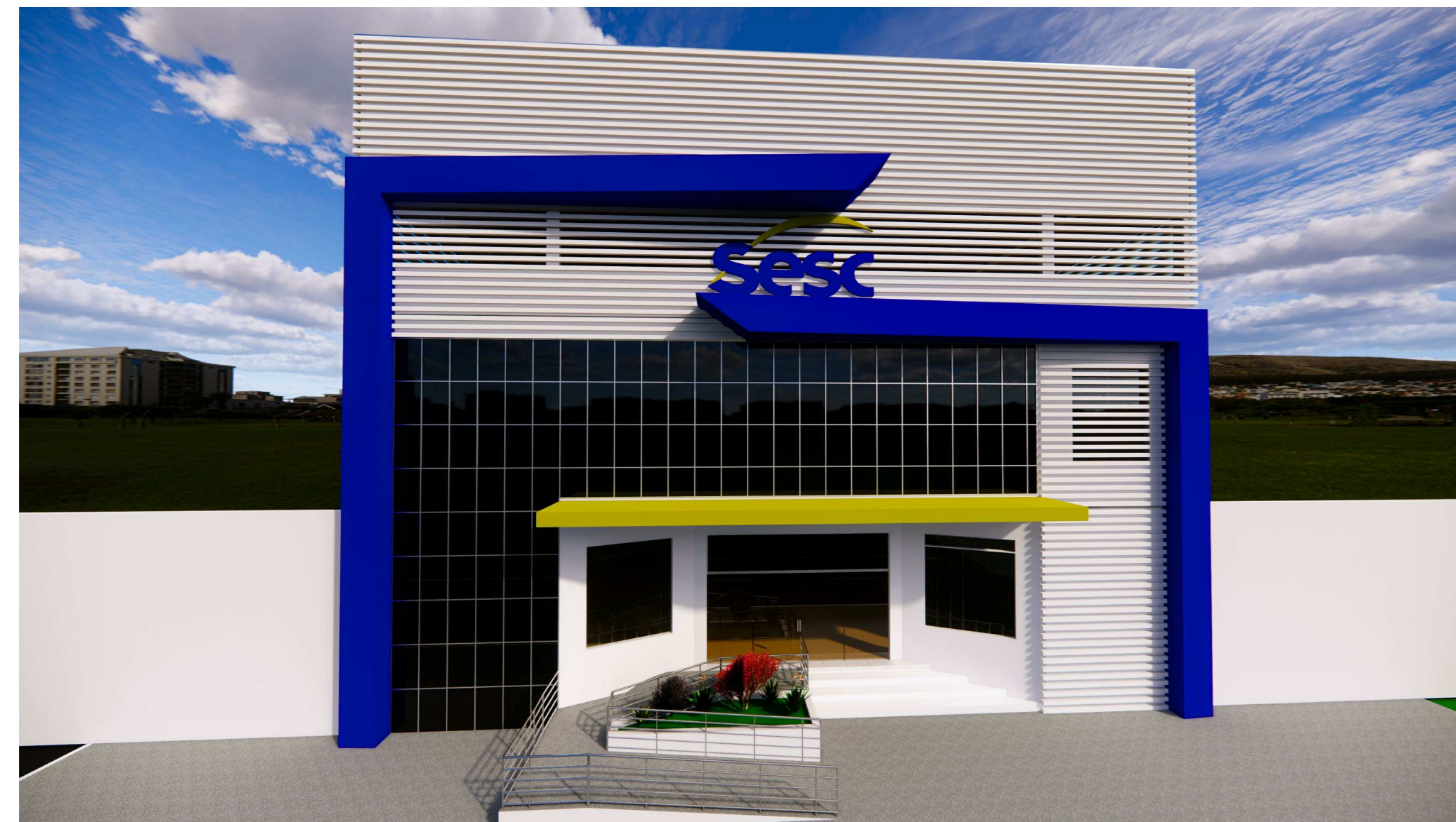
PERSPECTIVA FRONTAL 01 ESCALA: 1:5