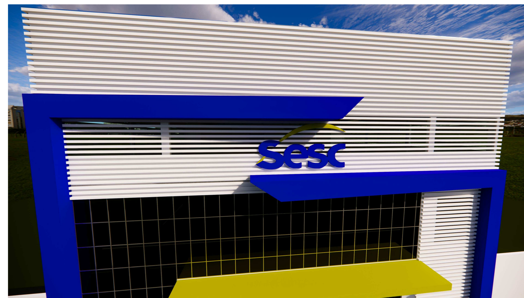
PERSPECTIVA FRONTAL 03 ESCALA: 1:5