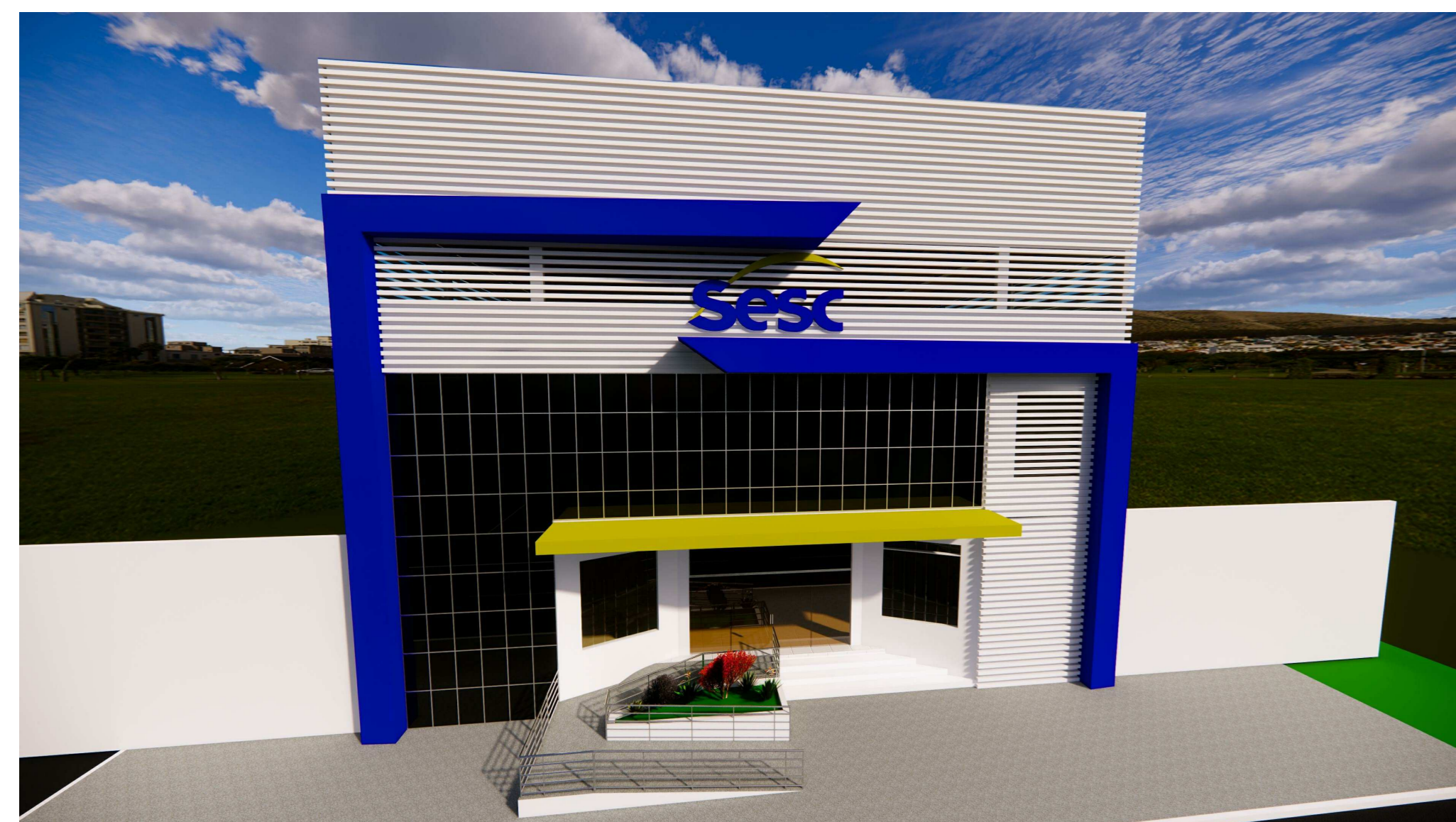
PERSPECTIVA FRONTAL 02 ESCALA: 1:5