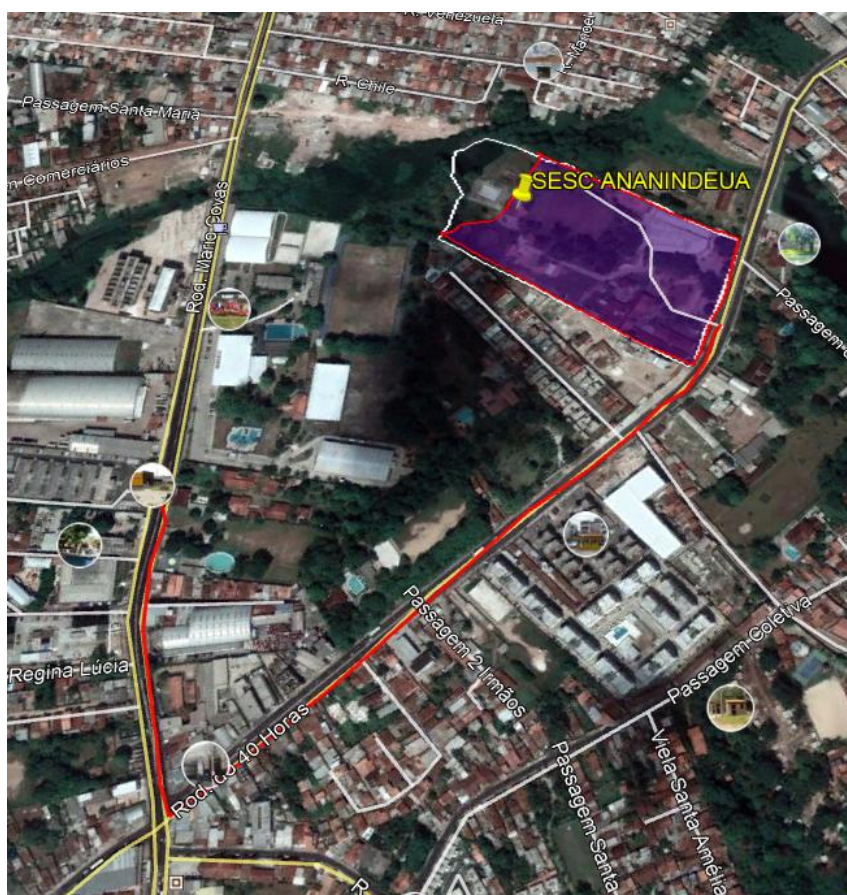
Localização do Hospital Estadual Galileu