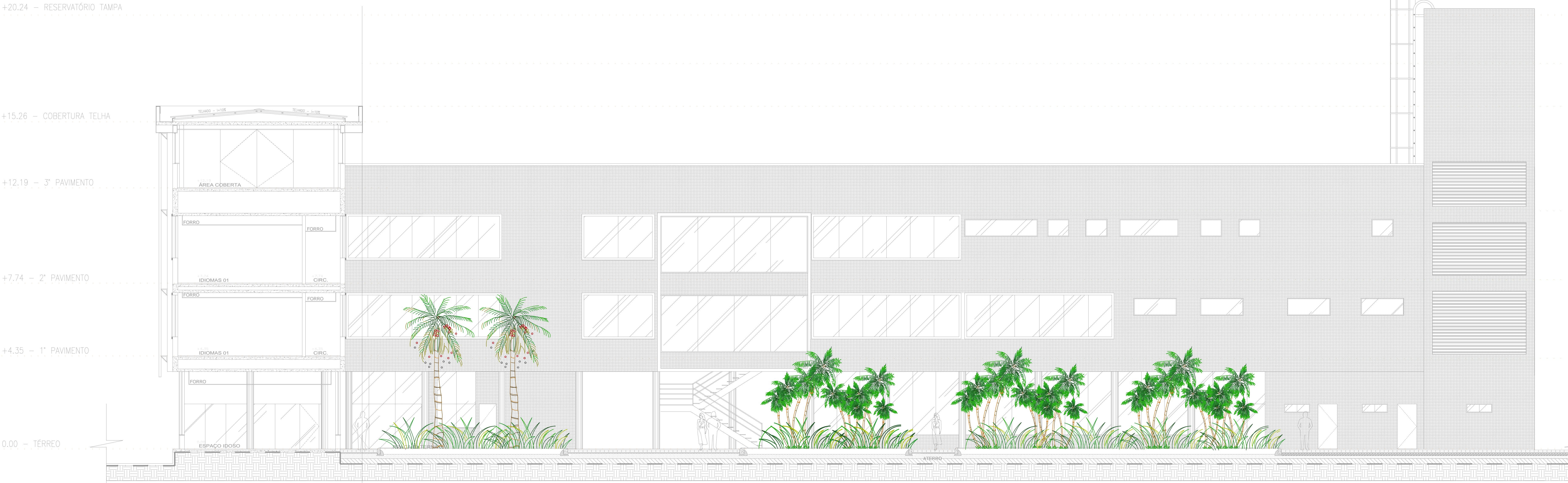
SEÇÃO - AA ESCALA 1/75