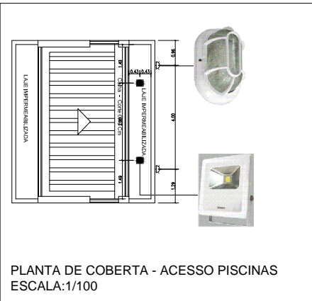
PLANTA DE COBERTA - ACESSO PISCINAS ESCALA: 1/100