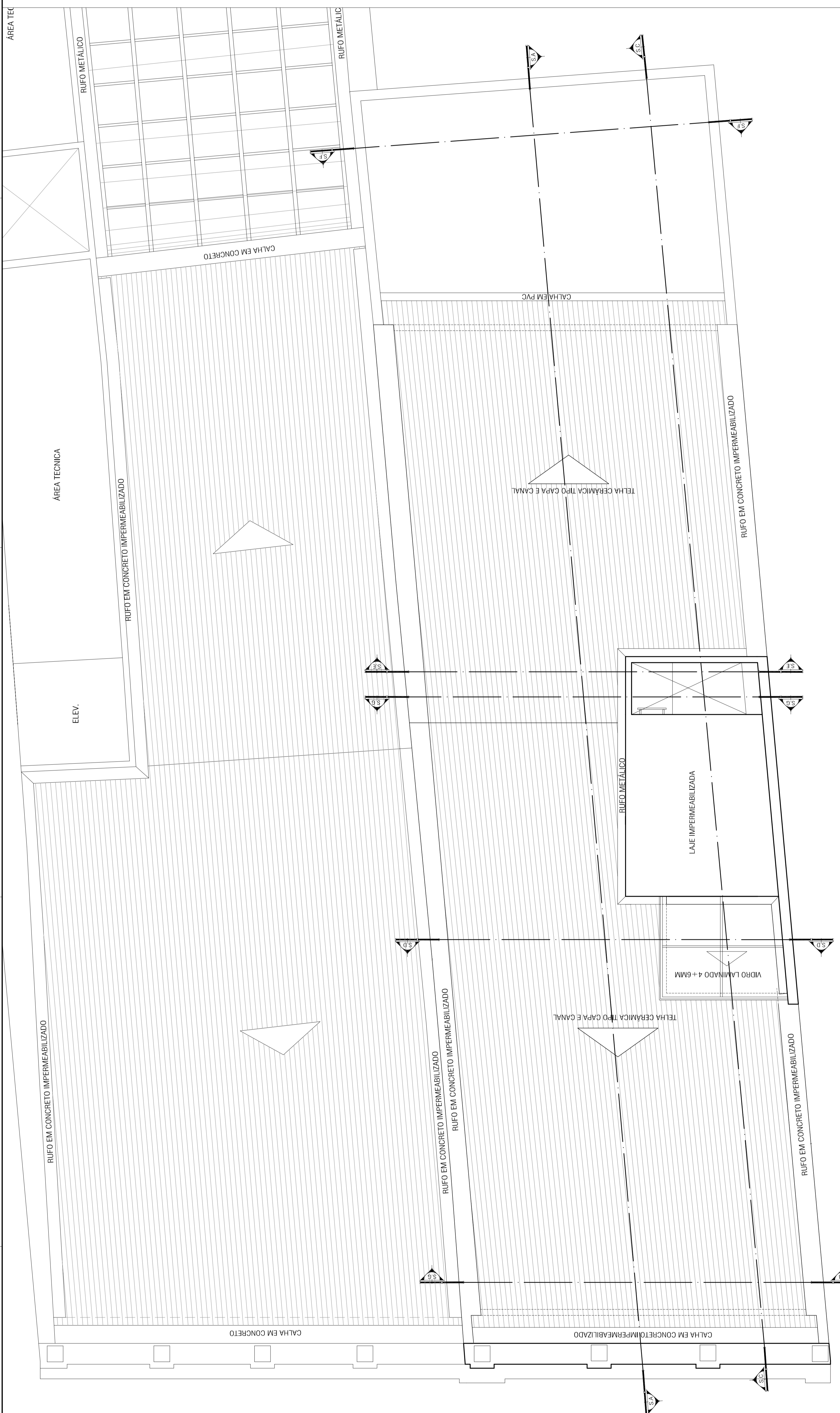
PLANTA DE COBERTURA ESC.: 1/20 Escala Gráfica